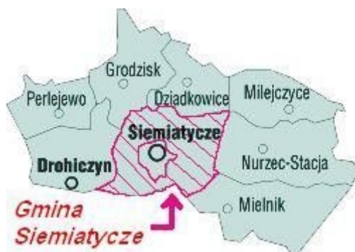
Rysunek 1. Położenie Gminy Siemiatycze w Powiecie Siemiatyckim

Korzystną cechą położenia gminy jest jej lokalizacja na skrzyżowaniu ważnych szlaków komunikacyjnych: drogi krajowej nr 19 (granica państwa, Białystok, Lublin, Stalowa Wola) i drogi krajowej nr 637 (Warszawa, Sokołów Podlaski, Radziwiłówka, granica państwa).