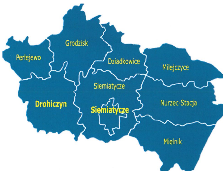
Rysunek 1. Mapa Gminy Siemiatycze.

Gmina składa się z 41 sołectw tj: Anusin, Boratyniec Lacki, Baciki Średnie, Baciki Dalsze, Baciki Bliższe, Boratyniec Ruski, Cecele, Czartajew, Grzyby-Orzepy, Kajanka, Kłopoty-Bańki, Kłopoty-Bujny, Kłopoty-Patry, Kłopoty-Stanisławy, Krupice, Klekotowo, Kułygi, Korzeniówka Duża, Krasewice, Klukowo, Lachówka, Leszczka, Moczydły, Ogrodniki, Ossolin, Olendry, Rogawka, Romanówka, Skiwy Duże, Skiwy Małe, Siemiatycze-Stacja, Słochy Annopolskie, Szerszenie, Turna Mała, Turna Duża, Tołwin, Wyromiejki, Wólka Nadbużna, Wiercień Duży, Wiercień Mały, Zalesie.